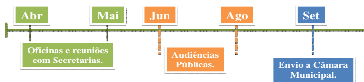
Figura 2 – Cronograma de Participação na Elaboração do PPA 2018-2021.

A Figura 2 ilustra o cronograma Plurianual Municipal.