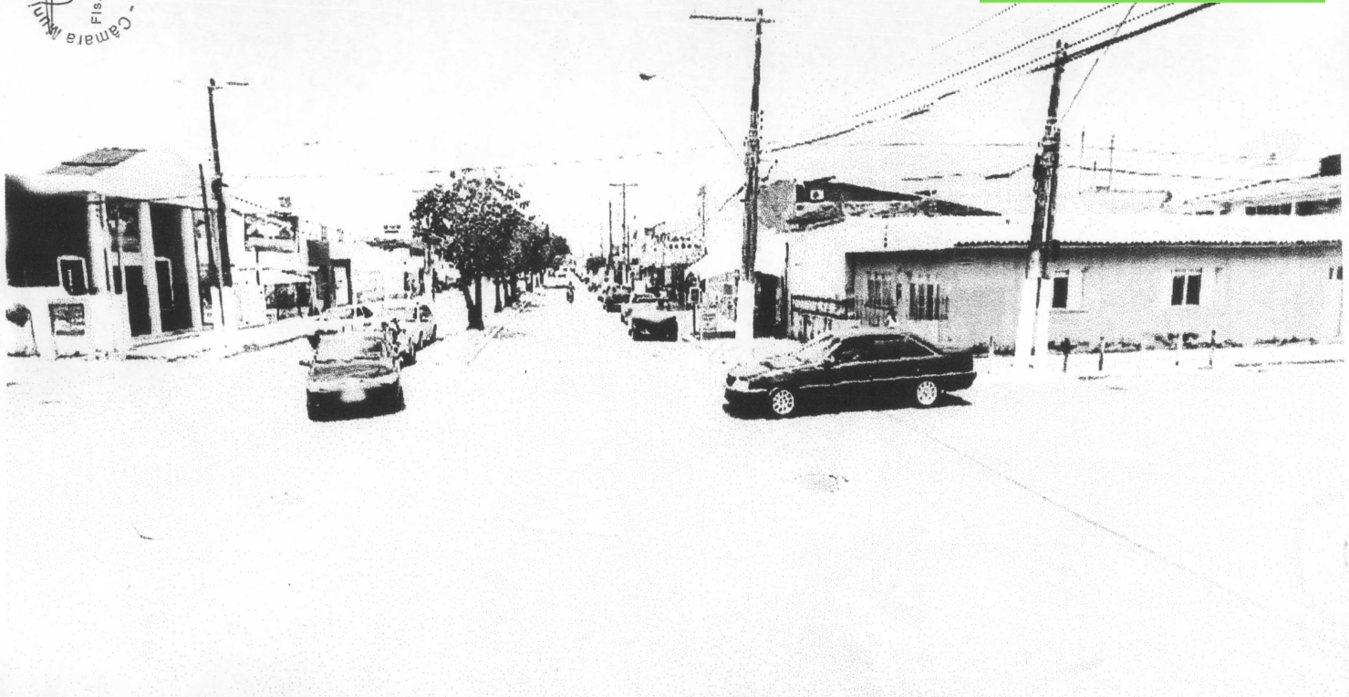
Interseção da Av. Sigheira Campos e a Rua do Ceará - Prado