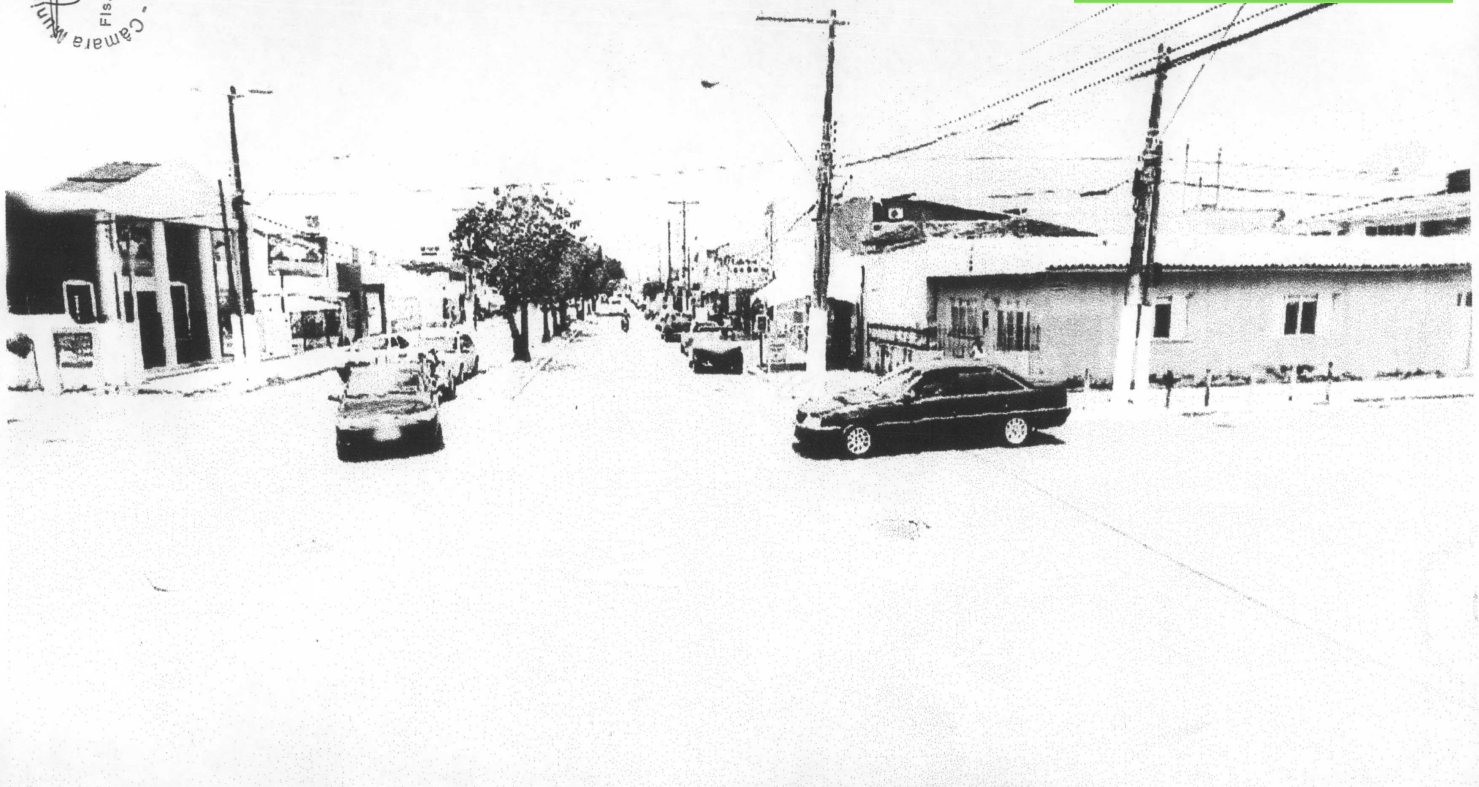
Interseção da Av. Sigheira Campos e a Rua do Ceará - Prado