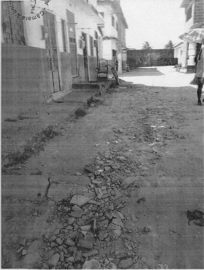
Travessa Lido Medeiros - Vergeal