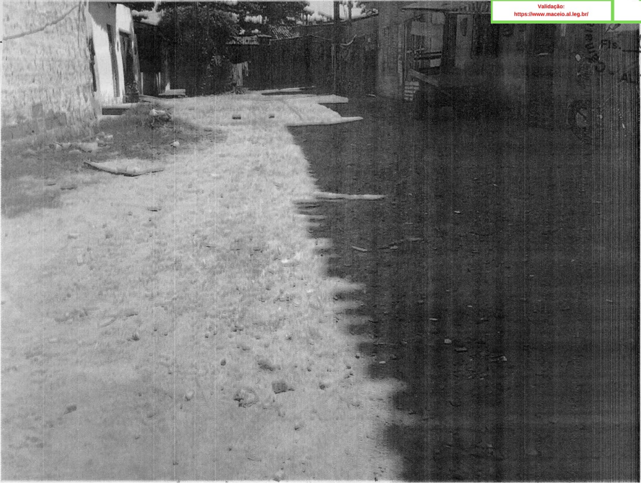
Travessa Rio Medeiros - Verzel