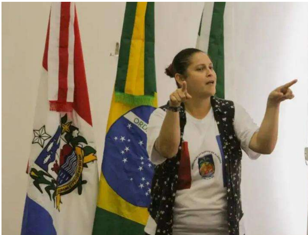
Auditório galba novaes camera políticas lutar faltam Maceió surdas os Educação escola bilingue , associação e acessibilidade Apoio @asal1990surdo . (25/03/2022)