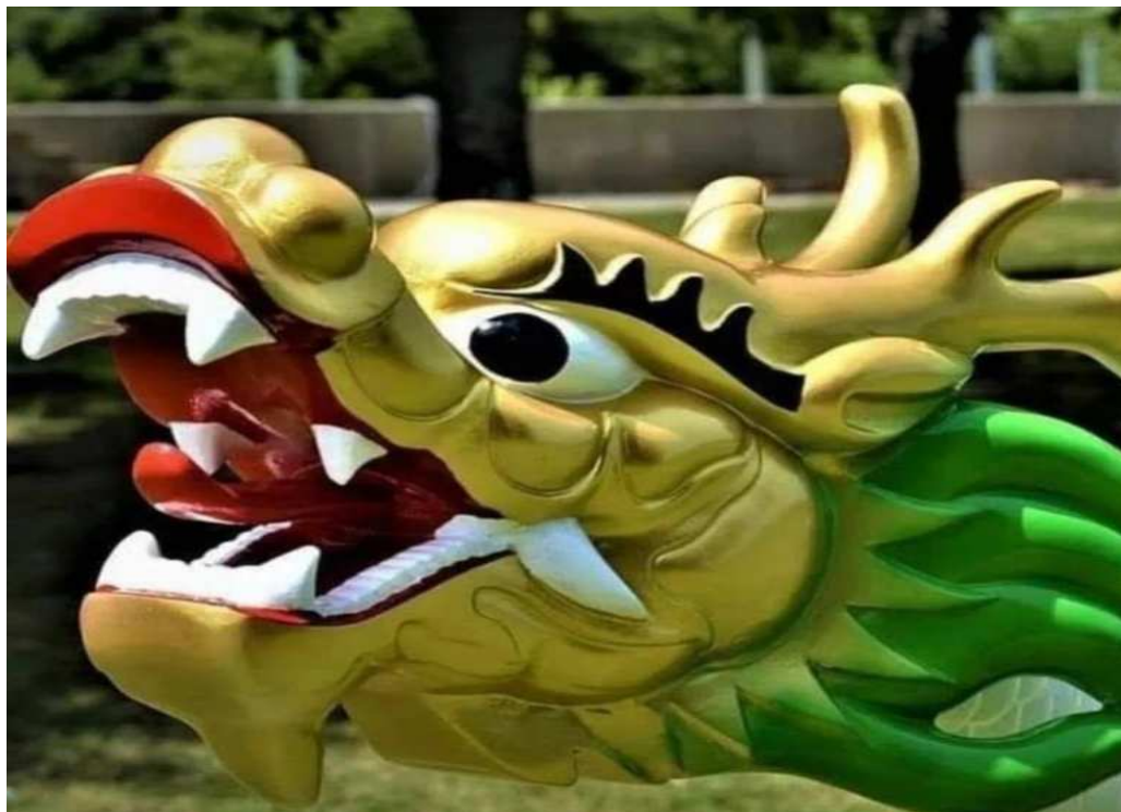
SIMBOLO – CARRANCA