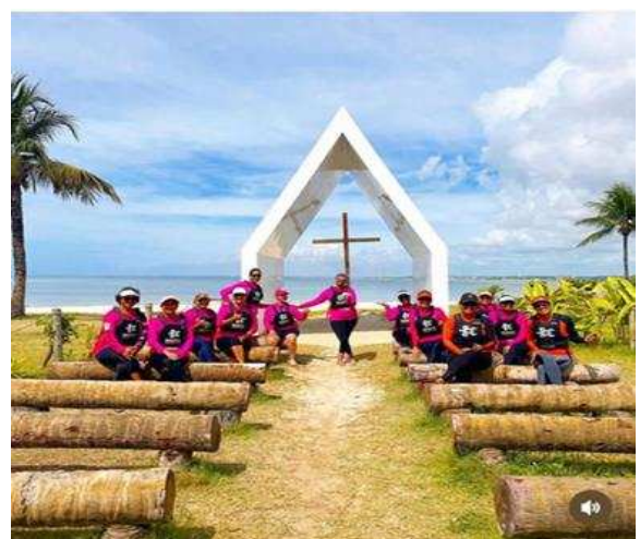
Dia Perfeito para visita a Capelinha de Jaraguá