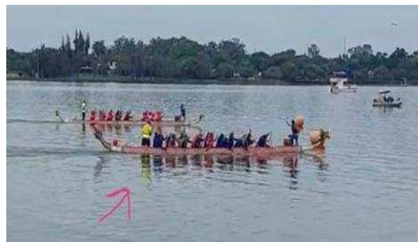
Barco que remamos.