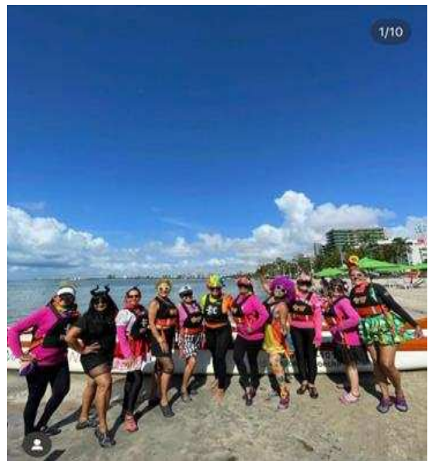
Carnaval – Folia no barco