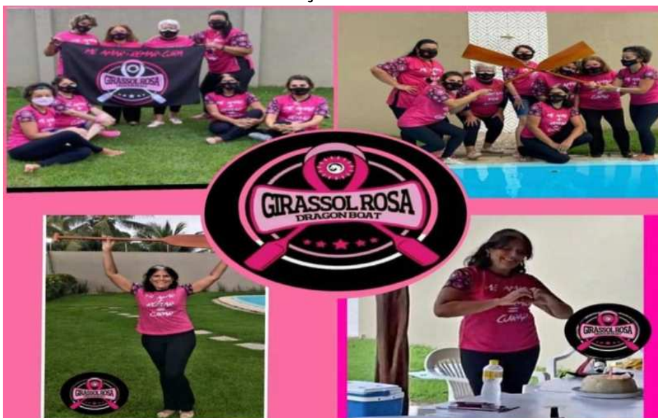
FORMAÇÃO DA DIRETORIA EM PLENA PANDEMIA DO COVID-19