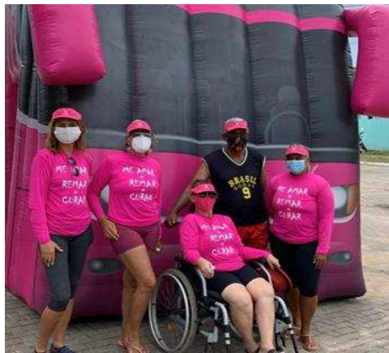
GIRASSOIS ROSA – SOBREVIVENTES CANCER