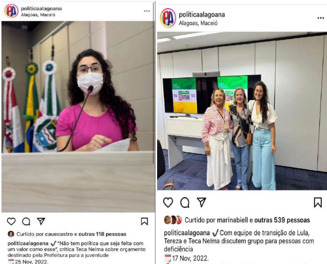
IMAGEM 11 E 1: REFERENTE A NF Nº 522