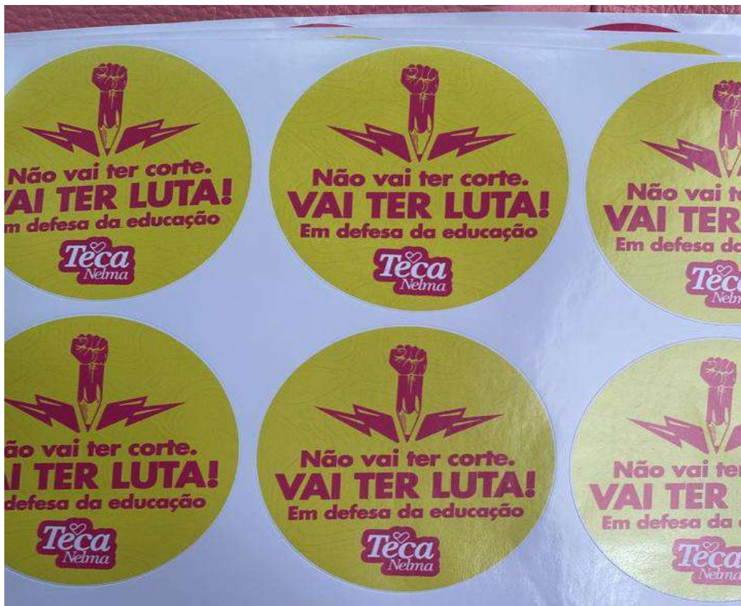
IMAGEM 6 E 7: REFERENTE A NF N° 89 E N° 1919 .