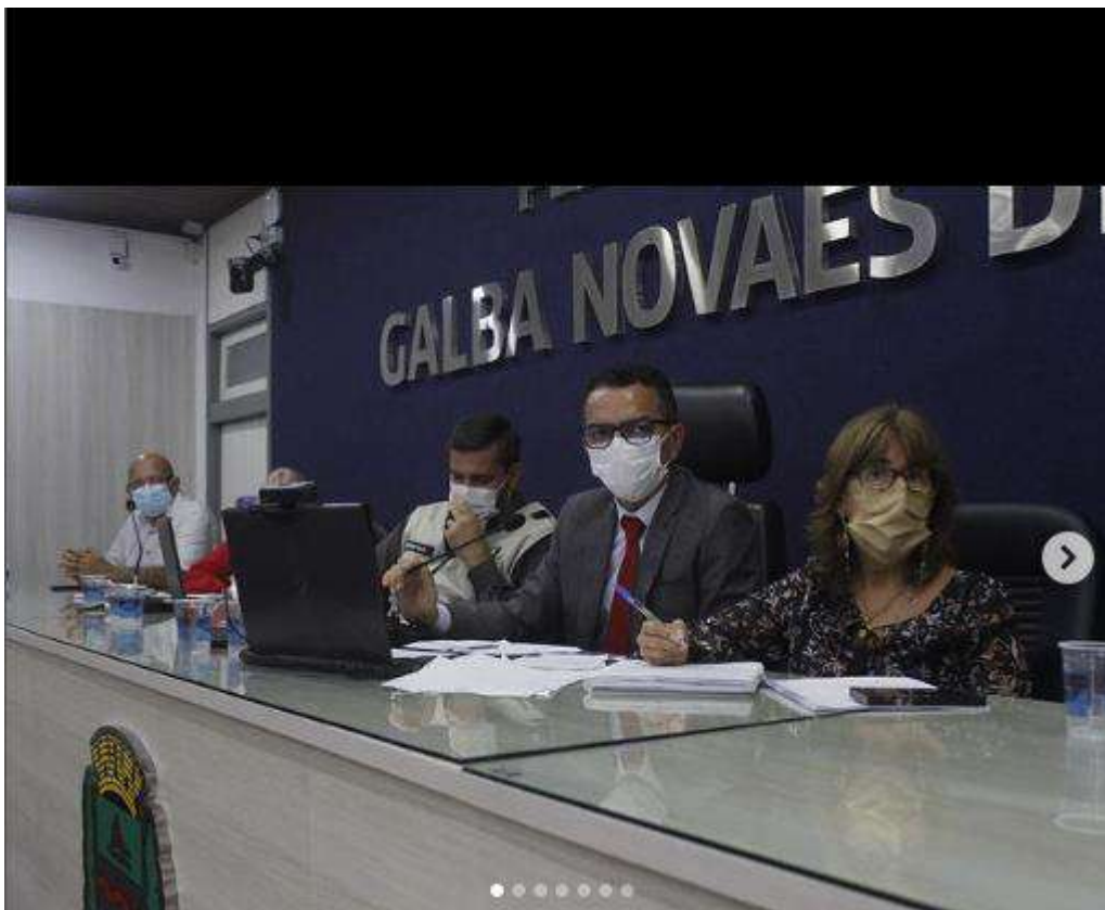
Sessão Ordinária da Câmara de Vereadores de Maceió