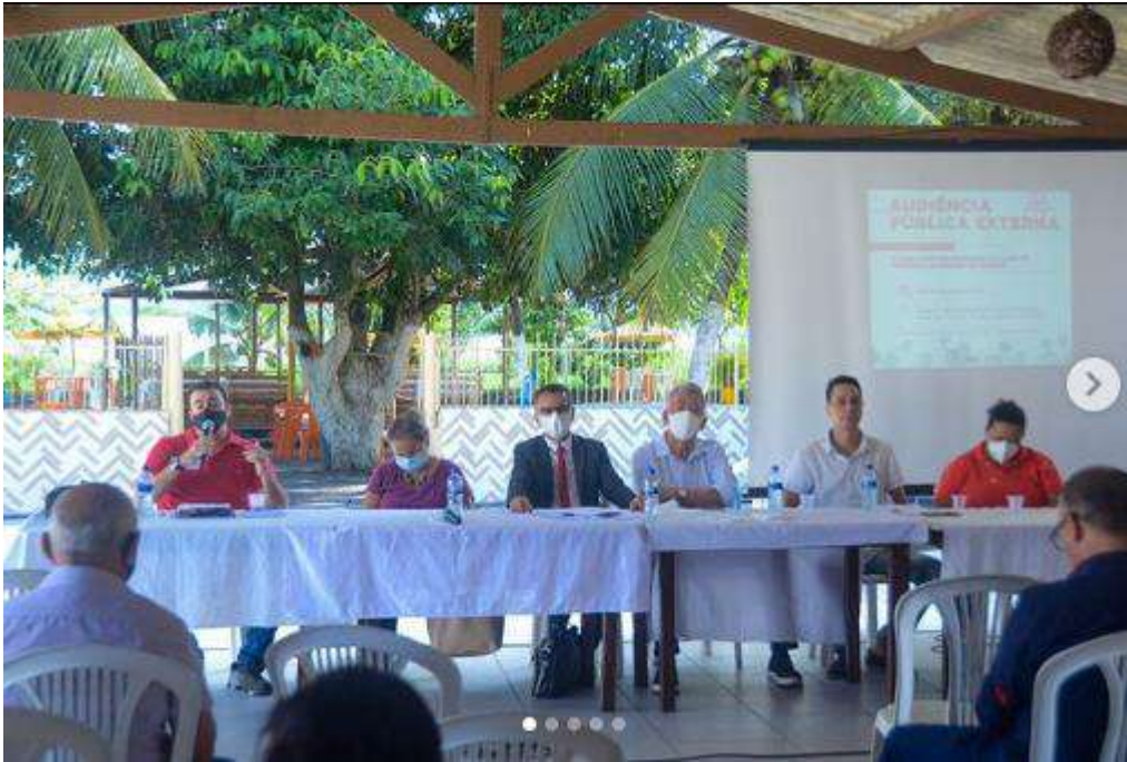
Audiência Pública Externa – Bairro Fernão Velho – Tema: Plano Diretor

Acreditando ser o relatório, suficiente para suprir qualquer dúvida da nota apresentada, aproveitamos a oportunidade para elevar meus sinceros protestos de estima e consideração.