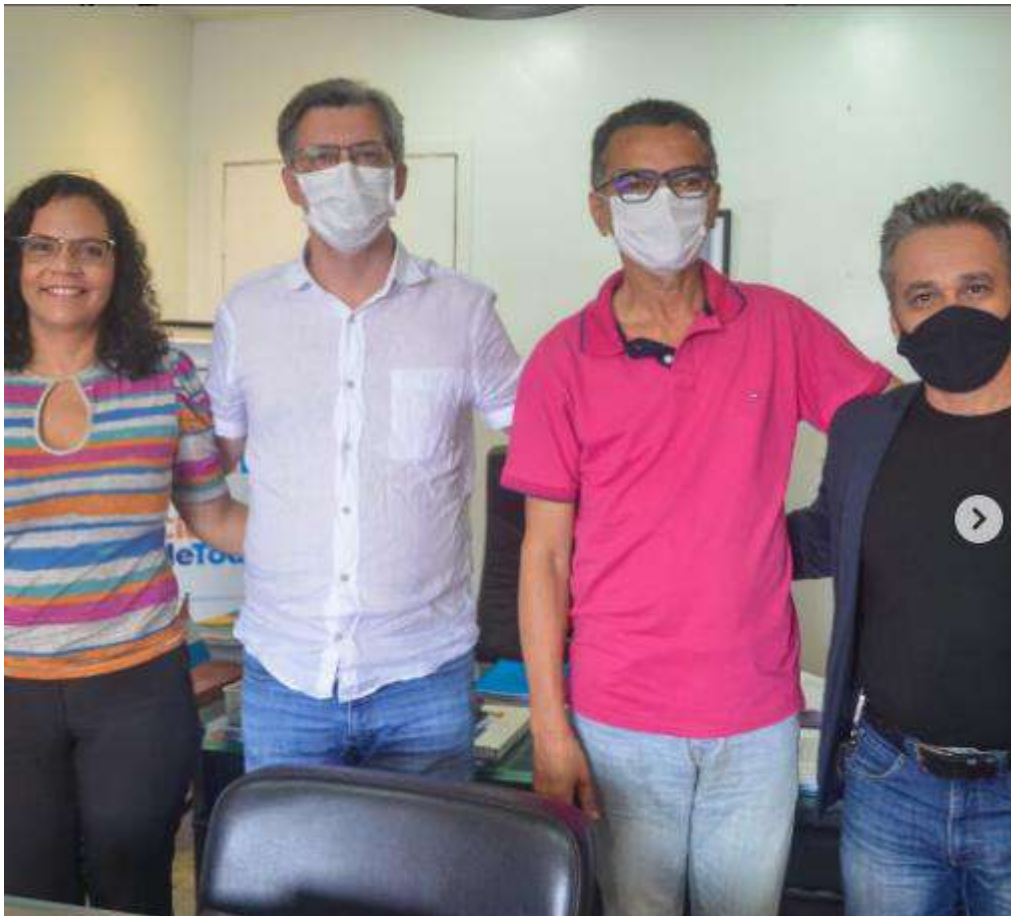
Reunião na SEMED MACEIÓ.

2. Registro de atividades do parlamentar em reuniões oficiais do gabinete.