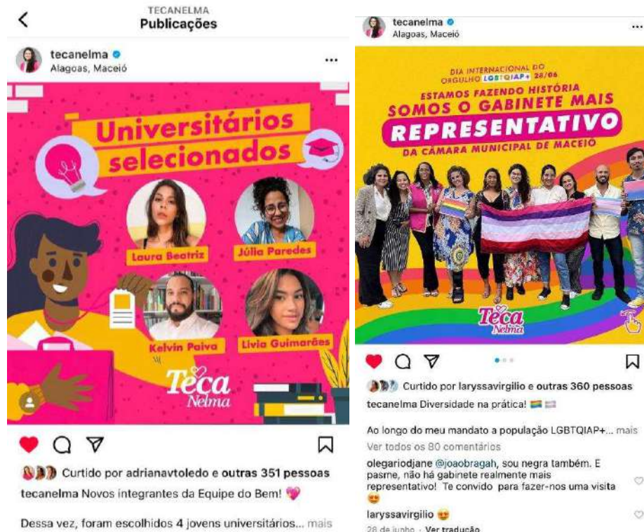
IMAGEM 5 E 6: REFERENTE A NF 29.

Assunto: Relatório detalhado referente as notas fiscais de serviços de despesa de mídia digital com nº 3071 e nº e 408 .