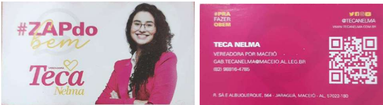
IMAGEM 1,2, 3 E 4: REFERENTE A NF N° 78 E N° 347.