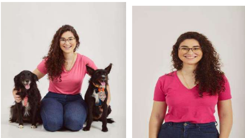
IMAGENS 10 E 11: REFERENTE A NF N°24