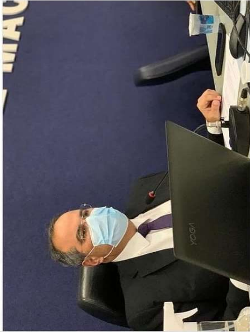
📌 Acesse a COVID-19: Central de Informações para obter recursos sobre a vacina. >