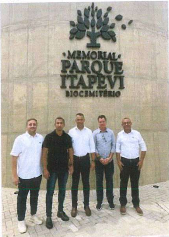
Vereador esteve no local do grupo que integra o Conselho Especial com o objetivo de reunir informações técnicas e de gestão do sistema de base para o relatório que será apresentado ao prefeito de Itaquá, JHC