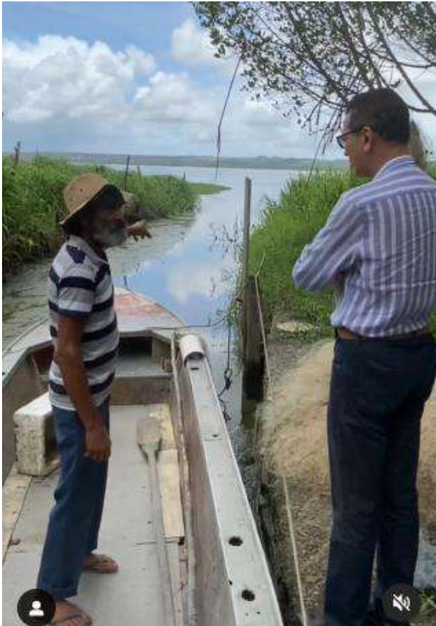
Visita a Associação dos Pescadores e Marisqueiras de Fernão Velho.