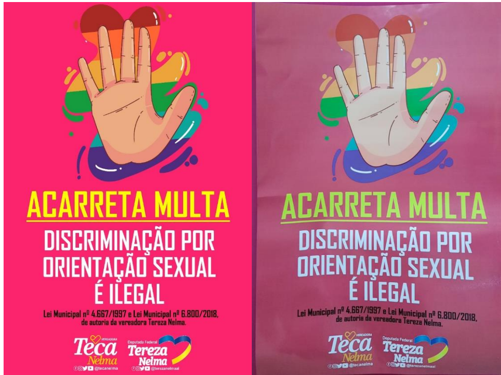
Figura 3: Impressão gráfica de 1 cartaz