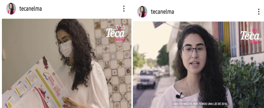
Figura 1: Vídeo da campanha “Prol das pessoas com autismo”

Trata-se da referida nota fiscal de despesa de filmagem com o CNPJ: 26.283.785/0001-40 e o Nº NFS-e: 51, onde foi realizado para a atividade parlamentar a produção de um vídeo. O vídeo é referente a ação da campanha em “Prol das pessoas com autismo”, onde foi realizado a filmagem para falar sobre a Lei municipal existe desde 2018, que determina que estabelecimentos de ensino, públicos e privados, devem manter em seu mural informativo com as características e sintomas do autismo. A Figura 1, referente ao vídeo da campanha.