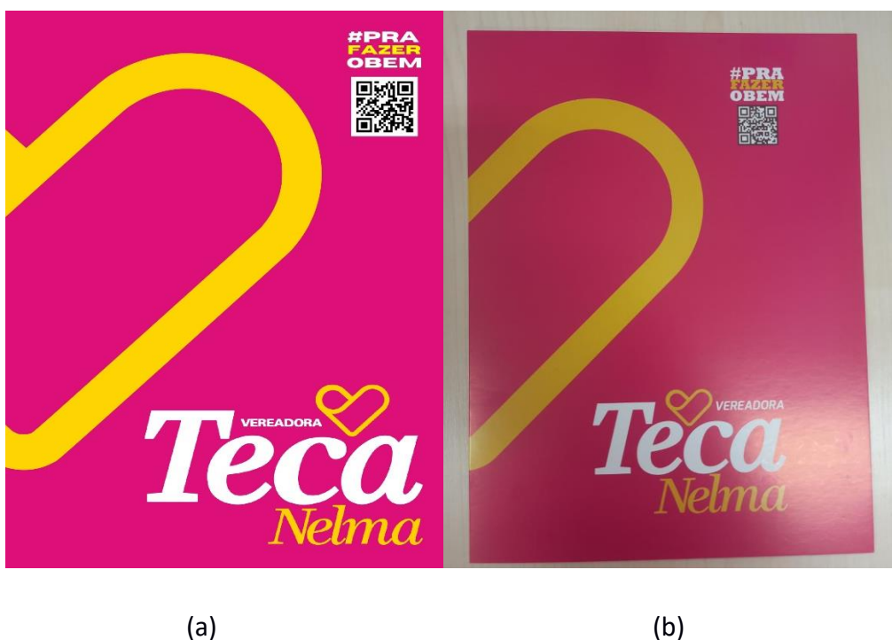
Figura 2: Impressão gráfica de 1000 pasta

A nota fiscal de despesa de impressão gráfica com o CNPJ: 37.216.963/0001-37 e o N° NFS-e: 12, onde foi realizado para a atividade parlamentar a produção de um cartaz sobre “Discriminação por orientação sexual é ilegal”. A Figura 3 é referente a arte para impressão (a) e o material impresso (b).