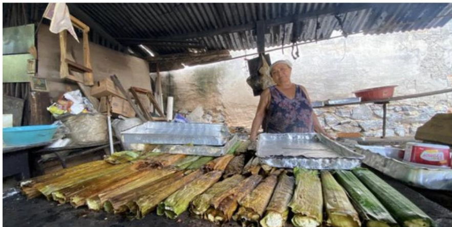
A produção dos bolos e doces garantiu ao bairro de Riacho Doce uma tradição